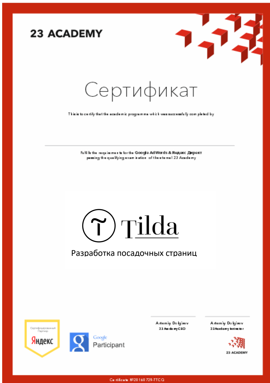
Рис. 1 Certificate Tilda, Разработка посадочных страниц

Certificate of Course Completion – сертификация о прохождении курсов По окончании всех занятий при прохождении экзамена студент получает сертификат о прохождении курса (рис.1)